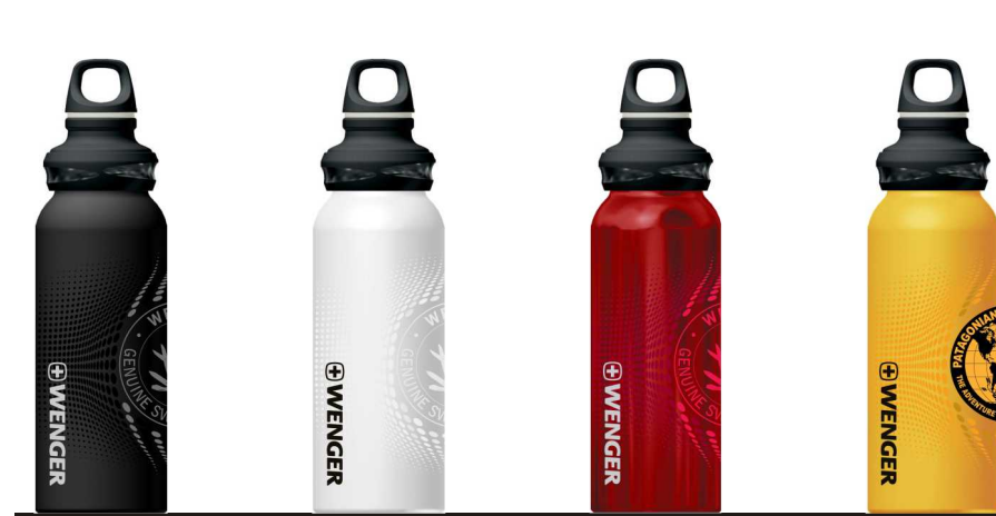
1510.00 black mat