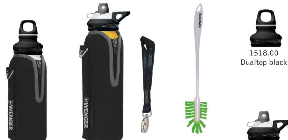
1519.00 Pouch 650ml neoprene