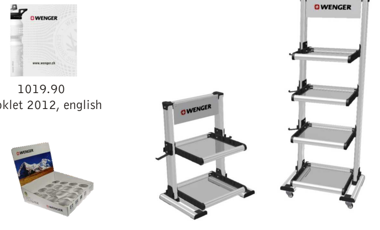
1019.90 Booklet 2012, english