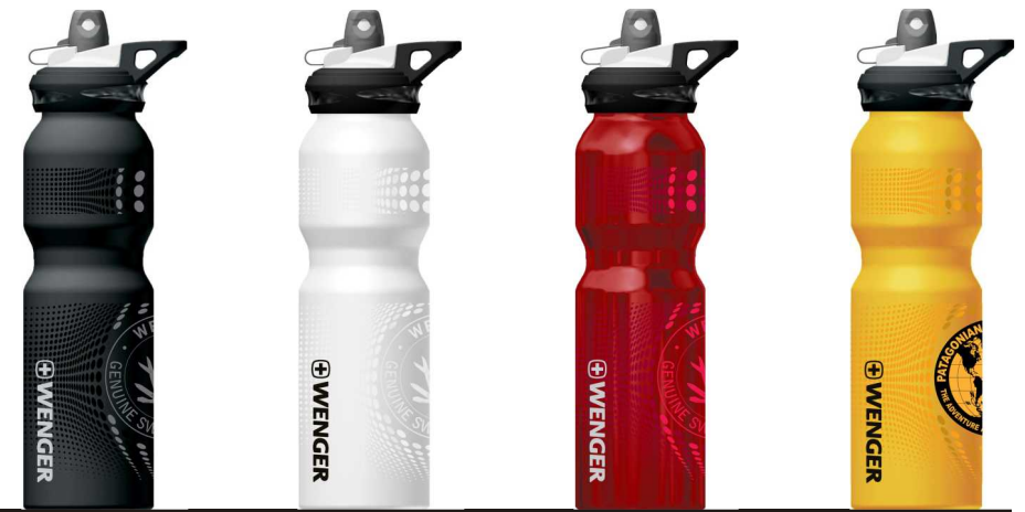
1710.00 black mat